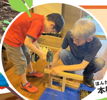
ほんだな 本棚やイスをつくる