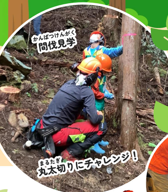
かんばつげんがく 間伐見学