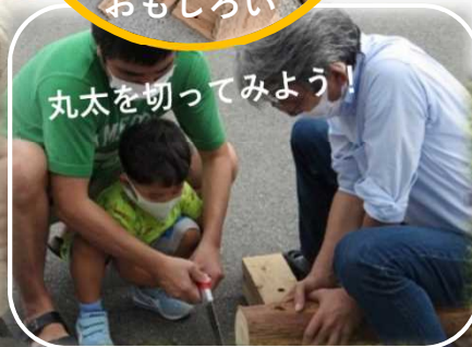
丸太を切ってみよう！