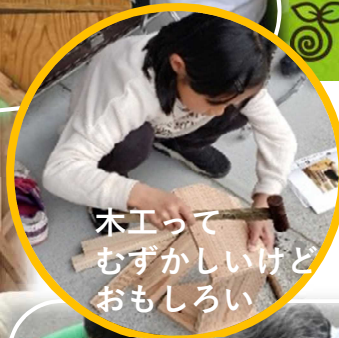
木工って むずかしいけど おもしろい